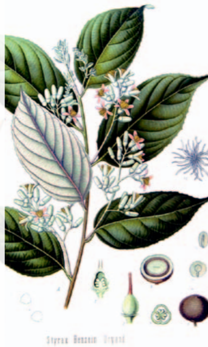
Syrax Benzoin Unquid

Merci de ne pas laisser des enfants sans surveillance dans l'exposition.